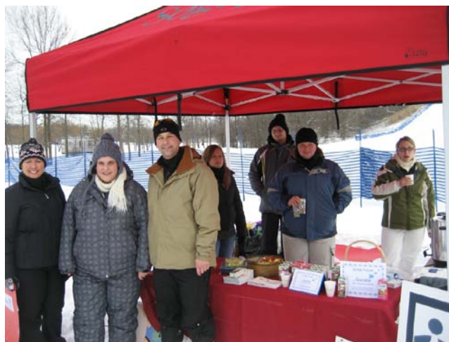
Kiosque – campagne de financement – arthrite juvénile