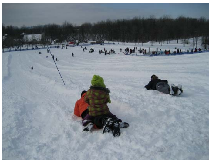
Journée plein air 6 février 2011 – Parc Michel Chartrand Longueuil