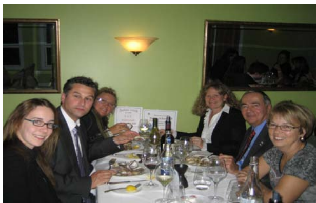
Souper d'huîtres le 20 octobre 2010 au Restaurant Oliveto à Longueuil.

Souper de homard en mai, « 5 à 7 » estival en juillet, Souper d'huîtres et Activité de formation en octobre, « 5 à 7 » automnal en novembre, Journée plein air en janvier, Soirée du hockey en février et Soirée théâtre en mars! Je suis fière de pouvoir dire qu'il y en avait pour tous les goûts!